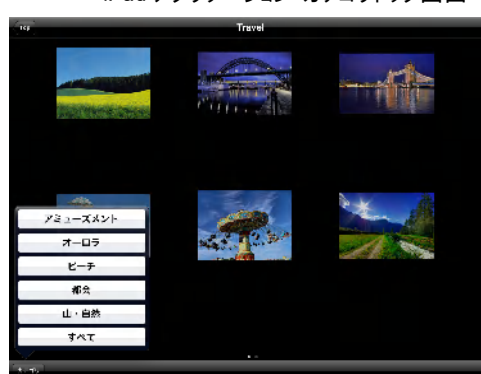
iPad アプリケーション カテゴリトップ画面