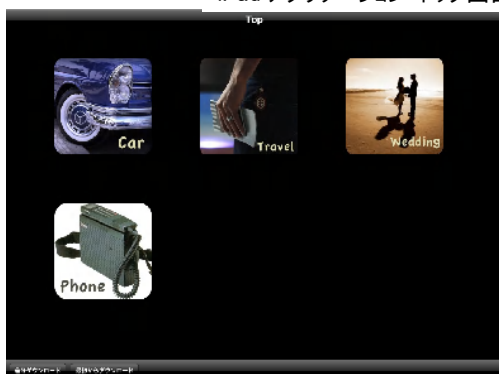
iPad アプリケーション トップ画面